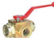
Üç Yollu Küresel Vana 3 Way Ball Valve