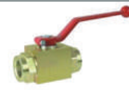
2 Yollu Küresel Vana 2 Way Ball Valve