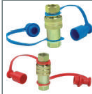
Tarım ve Traktör Makinaları İçin Otomatik Rakorlar Agricultural and Tractor Series